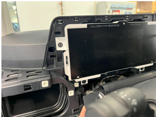
Her skal du omsider komme frem til display. Skru ut displayet og legg til siden.