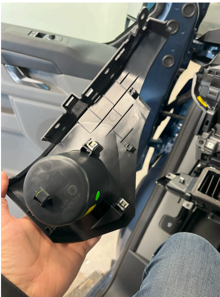
Ut med koppeholder.