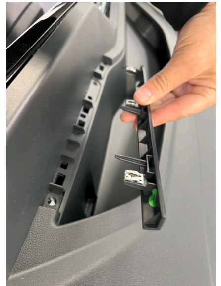
Av med list og ut med skruer bak skjerm.