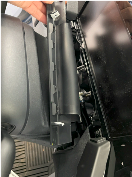
List over rattstamme.

Start med å demontere paneler i dashboard for å komme til bilens spillermodul.