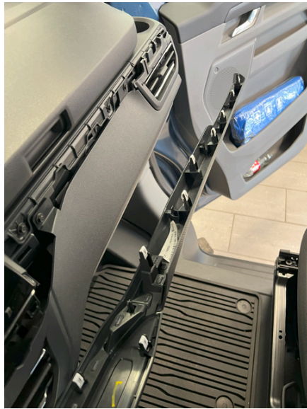
List videre mot passasjer side.